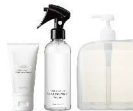
TORICURE ・BASE S/BASE M/AK(500ml) ・1S/1M/2(900g) ・Week集中ケア(50g) ・付属品 BASE S/M/AK 専用ボトル ・付属品 1S/1M/2 デispenser