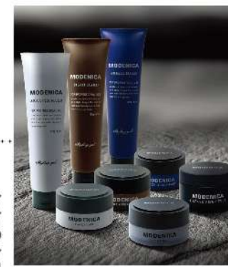
ハードジェル(150g)/ワックス&スモークマット(60g)/グリース4(90g)

美意識の高いメンズ向けに開発したスタイリングブランド。ジェル&ワックスが各3アイテムとスモークマット(クレイ)、グリースの計8アイテムのラインナップ。あらゆるシーンで、男の遊び心とカッコよさの両面を表現できるブランドです。