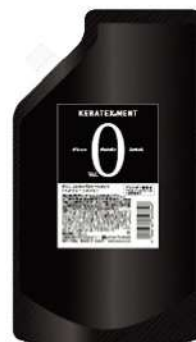
グリニコイロミズ アッシュウイン (250g)