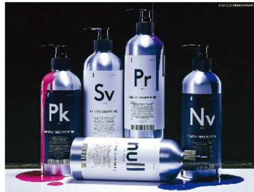
カラタスシャンプー エヌエイチツープラス(パープル/ピンク/シルバー/ネイビー/無色) ・シャンプー/トリートメント(500ml) ・各色詰め替え用レフィル(800ml)

「カラタス」の一般向け製品と異なる成分で、よりサロンでの使用に特化したシリーズ。カラーシャンプー&トリートメントといえば、ヘアカラーの褪色・変色防止のために使うのが一般的だが、「NH 2 + 」シリーズはその色み鮮やかさとしっかりと色が入る性能の高さから、ブリーチ毛に対する“染色”に使う使用法が美容師の間で広まっている。