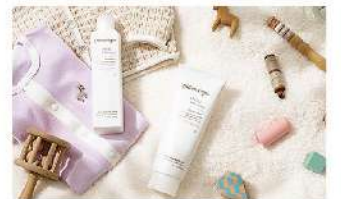
GENTLE SERIES (ジェントルシリーズ)