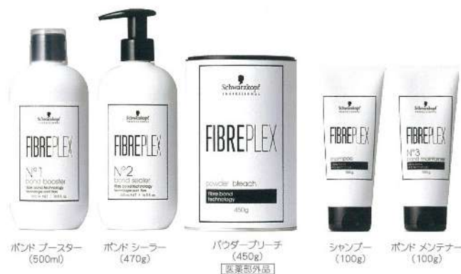
ボンド プースター (500ml)

*1 ドイツ本社研究所にて、ブリーチ剤(2剤は9%を使用)+ファイバープレックス No.1ボンド プースター、No.2 ボンド フィクサーとブリーチ剤(2剤は9%を使用)で比較した際の研究データ(最大値) *2 枝毛、切れ毛削減のこと