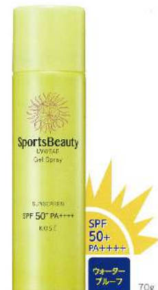
ウォータープルーフ 70%

シュッとひとふきで、ひんやりジェルがパウダーに変化する耐水UVジェルスプレー。過酷な紫外線から肌をまもりぬき、全身サラサラキープ。逆さ使用できるので背中や首の後ろ、つま先など、塗りにくい部位も簡単に強力UVカットできます。