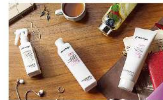
VIVIFYING SERIES (ヴィヴィファイブシリーズ)