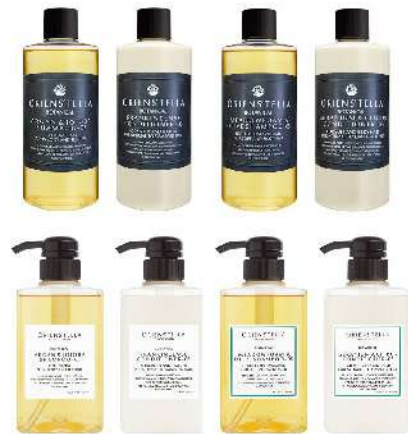
・ボリュームUP & らんわりハリコン 03 (150ml/300ml) ・ボリュームUP & やわらかな髪用 05 (150ml/300ml)

ビュアな植物成分と植物由来化学成分(ファイトケミカル)の融合により、髪や頭皮にやさしいだけではなく「ヘアスタイルの再現性」をより高めたオーガニックヘアケアシリーズ。