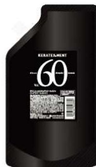
ハハニコグリ-60 リキッドトリートメント (500g)

高浸透：従来のトリートメントに使われるクリーム基材や高分子系シリコンなどの感触剤は浸透の妨げになることからリキッドタイプを採用。 高保湿：ただのリキッドではなく美容液のような高保湿性を持たせることでグリオキシル酸の製品にありがちな毛髪が硬くなるという問題をカバー。 両親煤：本来ならグリオキシル酸は毛髪になかなか浸透できないが絶妙なバランスで配合することで毛髪へ滑り込むように浸透。