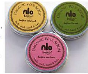
bojico rose/ bojico lavender

ひじやかかとのカサカサに潤いを与えます。ひと肌で融け馴染みやすく、べたつきが少ない。髪にツヤと潤いを与えながらスタイリングできる、トリートメントワックス。