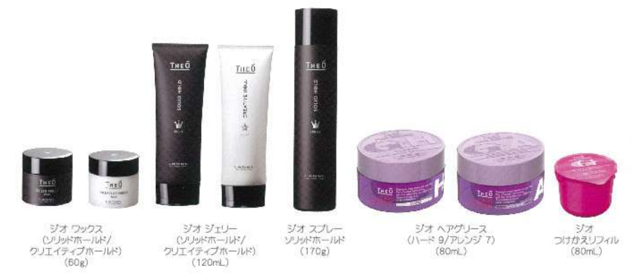
ジオー ワックス (シリコッドホールド/クリエイティブホールド) (60g) ジオー ジェリー (シリコッドホールド/クリエイティブホールド) (120mL) ジオー スプレー (シリコッドホールド) (170g) ジオー ヘアグリース (ハード 9/アレンジ 7) (80mL) ジオー つけかえリフィル (80mL)

シーンに合わせて選べるスタイリングアイテムをラインナップ。男を魅力的に演出するヘアスタイルがとれます。