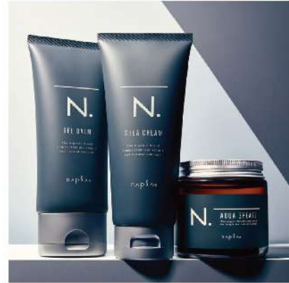
N. オム ・シモエクリーム(40g/100g) ・ジェルバーム(40g/100g) ・アクアグリース(80g/100g)

良質なスタイリング剤を使う。それって自分がワンランクアップした気がする。でも、単に入っている成分がいいとか、高機能だとか、そういうことだけじゃない。今日の気分が寄り添い、適当に髪を動かしてくれるひと言でいえば、いい案配のファジー感。質感も束感も限りなく自由なスタイリング剤をこれからの、あなたの毎日に。