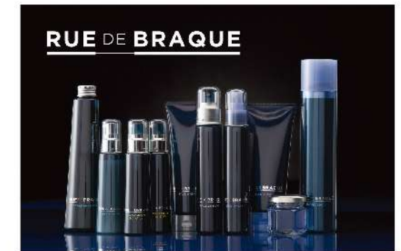
スカルプライン ・フレグランス ジェル(30g×10本) ・スカルプ シャンプー(300ml/1000ml) ・エクストラ セラム(100ml) スタイリングライン ・ソリッド グリース(50g) ・ハードジェル(200g) ・リキッド ワックス(120ml) ・ハード スプレー(180g) スキンケアライン ・フェイスウォッシュ(130g) ・フェイスローション(120ml)

スカルプライン: 高まる男性の美意識に、効果的なトータルケアのご提案とサポートを。 スタイリングライン: 動き、束感、質感、はっきり表現。ハードなスタイルをキメるセット力とすぐれた洗い落ちにこだわったノンシリコンスタイリングライン。 スキンケアライン: 時間をかけずに好印象肌へ。