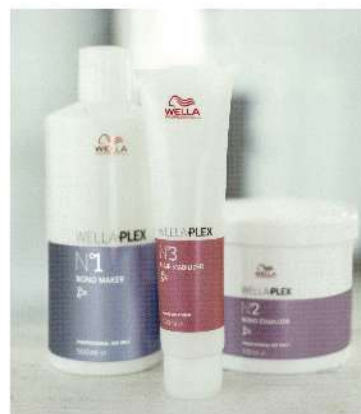
・N°1 ボンドメーカー(500ml) ・N°2 ボンドスタビライザー(500g) ・N°3 ヘアスタビライザー(100g)

WELLAが開発するPLEX剤。手触りも色も妥協しない、無限の変化の可能性を。髪を骨組みから創るという発想：強い髪の土台作り*で、ハイトーンやブリーチ施術を伴うデザインも、ダメージを恐れない髪へ。 ※補修による ヘアカラー・ブリーチが最適に作用するpH設計：色素の浸透と発色、リフト力を最大限に。