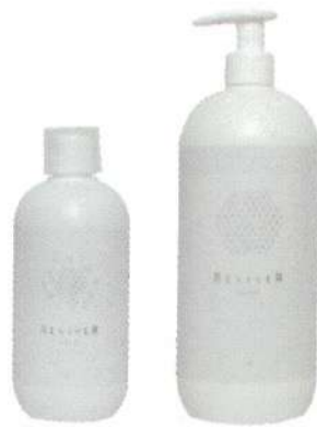
R-starter(500ml) R-finisher (990g)

強く美しい本来の髪へ。髪の内部に働きかける独自の新技術「インアール(InR)」テクノロジーにより、ヘアカラーのダメージを軽減します。カラーの度に繰り返し使用することで、よりダメージに強いすこやかな髪に導きます。