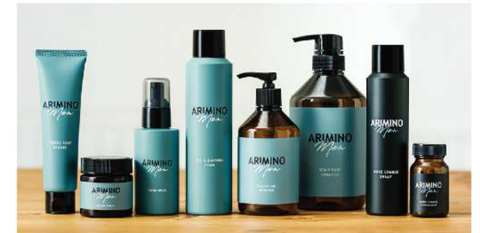
・オイルフレグランスフォーム(180g) ・スカルプケア シャンプー(280ml/680ml/1000ml) ・モアチャージ スプレー(90g) ・モアチャージ サプリメント(90粒) ・フリーズキープ グリース(100g) ・ハード バーム(60g) ・ハード ミルク(100g)

健やかな頭皮と髪のためのヘアケア。男の爽やかさをサポートするインナーケア。清潔感と身だしなみをキープするスタイリング。「アリミノ メン」は、毎日ポジティブにする新発想のメンズブランドです。