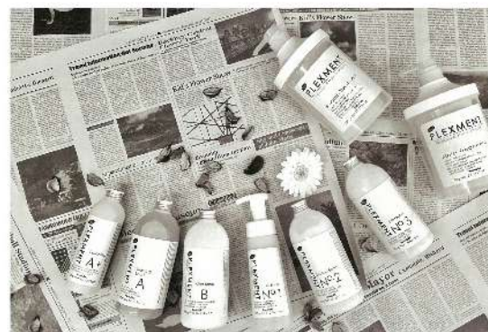
・リラクシング A+(300g) ・リラクシング A(480g) ・アフターボンド B(480g)

18種類の天然アミノ酸とジカルボン酸で髪質改善。フラーレンとグリオキシル酸の相乗効果でトリートメントの持ちをより持続。