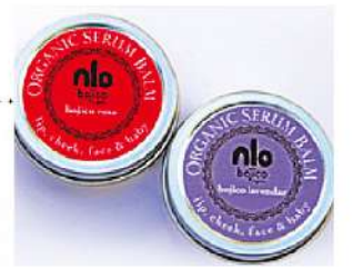
original/bojico forest/ bojico melissa

肌を乾燥から守り潤いを与えます。ひげ剃り後や、お子様の顔のカサカサにもテカらずしっとり保湿。トリートメントワックスとしてお使い頂けます。