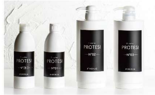
F.color PROTESI Fカラー プロテジ ・B/O1(300ml) ・D2 エコインボトル/リフィル(550g) ・D3 エコインボトル/リフィル(550g)

カラースタイルをもっと自由に芯からしなやかに美しく強い髪へ。ダメージを恐れない進化したプレックス系トリートメント。ブリーチ・カラーの薬剤によって起こるダメージから保護し、質感やスタイルの維持が可能に。個性を活かす、ハイトーンカラーやデザインを提案できます。