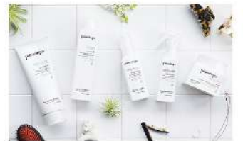
BALANCE SERIES (バランスシリーズ)